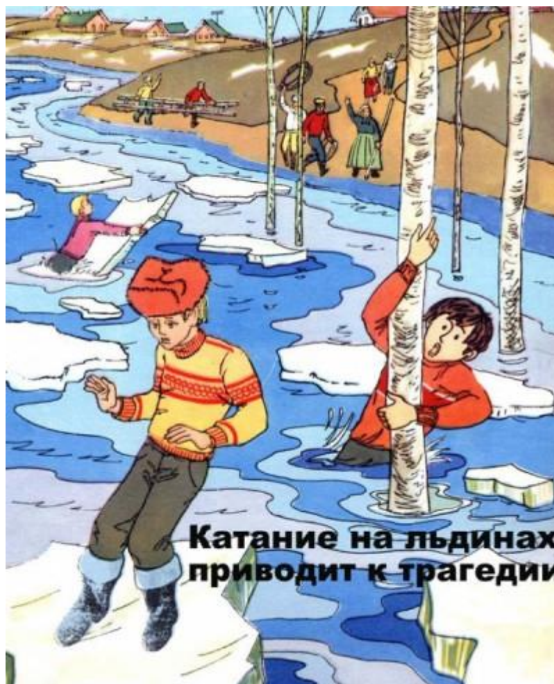
Катание на льдинах приводит к трагедии

Приближается время весеннего паводка. Лед на реках становится рыхлым, «съедается» сверху солнцем, талой водой, а снизу подтачивается течением. Очень опасно по нему ходить: в любой момент может рассыпаться под ногами и сомкнуться над головой.